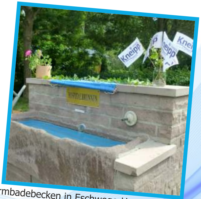
Armbadebecken in Eschwege-Hospitalbrunnen Birkengrund/Boyneburgerstraße